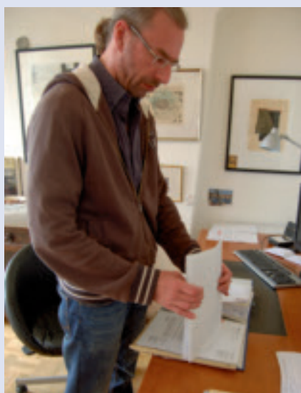
Bereitet sich auf eine Klage vor: Bisher ist keine Schadensregulierung erfolgt

Bei Freiberuflern und Selbstständigen streiten sich die Parteien häufig um die Festsetzung von Verdienstaufschlägen. Durch das ständig schwankende Einkommen können Selbstständige nur sehr selten genau